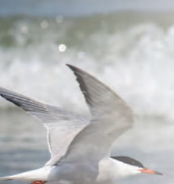
Photo : Sterne pierregarin

Espèces d'intérêt : Bernache cravant, Sterne pierregarin, Harelde kakawi, Grand Héron, Cormoran à aigrettes, Arlequin plongeur, Garrot d'Islande.