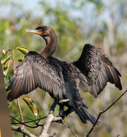
Photo : Cormoran à aigrettes