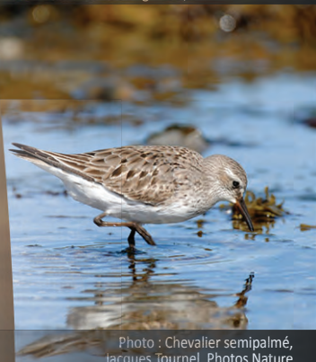
Photo : Chevalier semipalmé